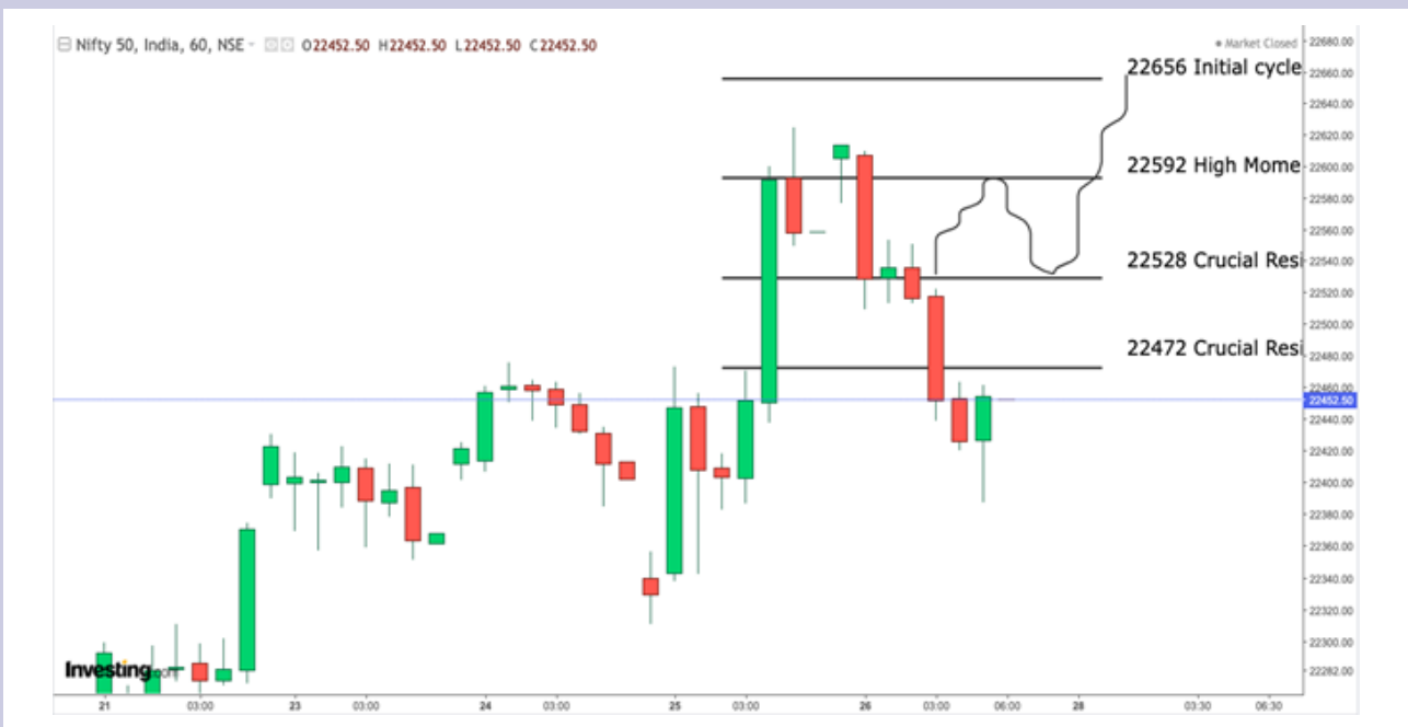
(NIFTY Bullish Cycle Possibility for Monday)

But if the index has to reach the cycle completion level of 22656, it has to essentially break the initial resistance at 22472. After breaking the initial resistance index must break the level 22528 and later said level should be taken as a support.